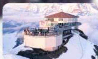
ทานอาหารที่ Piz Gloria ทัศนียภาพที่ทมนต์ได้ 360 องศา