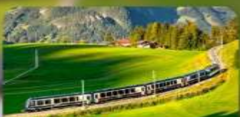
นั้งรถไฟสายโรเมนติก 3 สาย Golden Pass / Luzern Interlaken Express / Gornergrat