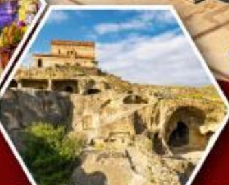
เมืองถ้ำอพิลิสต์ซิคเค์