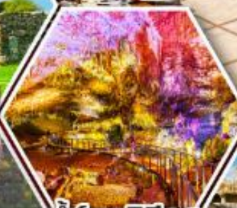
น้ำพอร์บิธิอุส