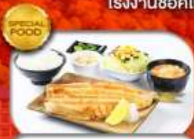
เมนูพิเศษ Set ปลาฮอกไกโด