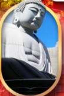
พระใหญ่อะตามะ