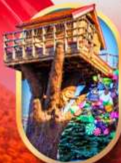
โรงงานช็อคโกแลต