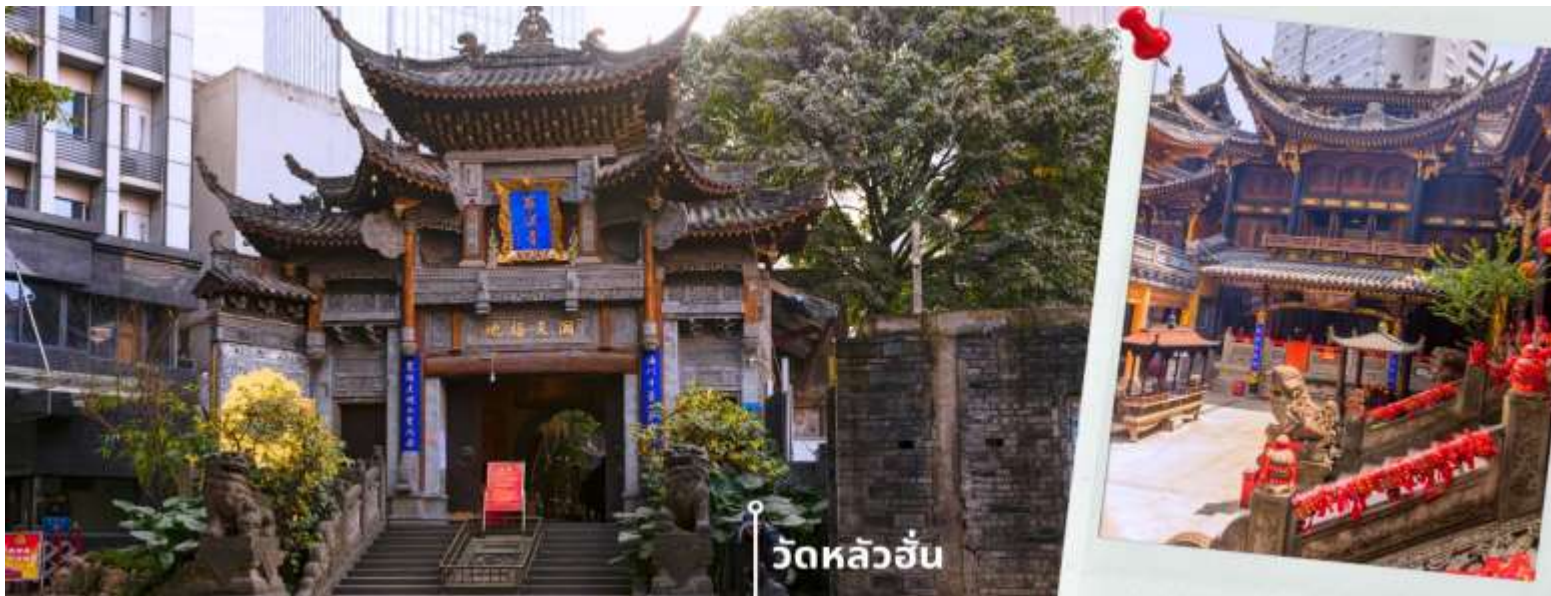
วัดหลัวฮั่น

นำท่านเดินทางสู่ วัดหลัวฮั่น (Luohan Temple) วัดสำนักงานใหญ่พุทธสมาคมแห่งนครฉงชิ่ง เป็นวัดเก่าแก่ที่สุดในฉงชิ่ง (Chongqing) ซึ่งสร้างขึ้นเมื่อ 1,000 ปีก่อน มีประวัติความเป็นมายาวนานเป็นจุดหมายทางศาสนาและเป็นศูนย์กลางของชาวพุทธในภูมิภาคการท่องเที่ยวที่สำคัญของภูมิภาค และเป็นแหล่งเรียนรู้ที่สำคัญของศิลปวัฒนธรรมจีน วัดนี้ประดิษฐานพระอรหันต์ถึง 500 องค์ แต่ละองค์มีลักษณะ ท่าทาง และสีหน้าแตกต่างกัน มีสถาปัตยกรรมแบบจีนโบราณที่สวยงามและละเอียดอ่อน พระอรหันต์ 500 องค์ แกะสลักด้วยหินและไม้ สะท้อนถึงความเชื่อในพุทธศาสนาและมีมือศิลปะจีน