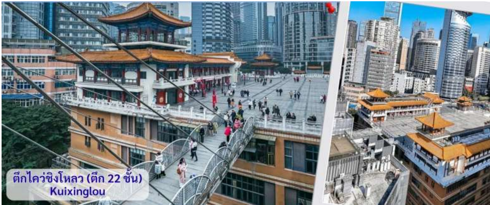
ตึกไควชิงโหลว (ตึก 22 ชั้น) Kuixinglou

จากนั้นอิสระถ่ายรูปหน้าตึกตะเกียบ ฉงชิ่ง(ด้านนอก) คือ ฉงชิ่งกั๋วไท่อาร์ตเซ็นเตอร์ (Chongqing Guotai Arts Center) เป็นแลนด์มาร์คสำคัญที่มีสถาปัตยกรรมคล้ายตะเกียบยักษ์สีแดงและดำวางซ้อนกัน เป็นศูนย์จัดแสดงงานศิลปะและสถานที่ท่องเที่ยวที่นิยมสำหรับการถ่ายรูป โดยเฉพาะในเวลากลางคืนเมื่อเปิดไฟสวยงาม สิ่งก่อสร้างอันมีเอกลักษณ์ อาคารนี้ถูกวางโครงสร้างให้มีรูปร่างคล้ายกอง "ตะเกียบยักษ์" สีดำและแดงที่วางซ้อนกันเป็นชั้นๆ ที่ส่วนปลายของตะเกียบสีแดงจะมีตัวอักษรจีนคำว่า "กั๋ว" ประทับอยู่ ซึ่งมีความหมายถึง ชาติหรือประเทศ ส่วนที่ปลายตะเกียบสีดำ จะมีอักษรจีนคำว่า "ไท่" ประทับอยู่ ซึ่งหมายถึง ความเจียบสงบ หรือความอุดมสมบูรณ์