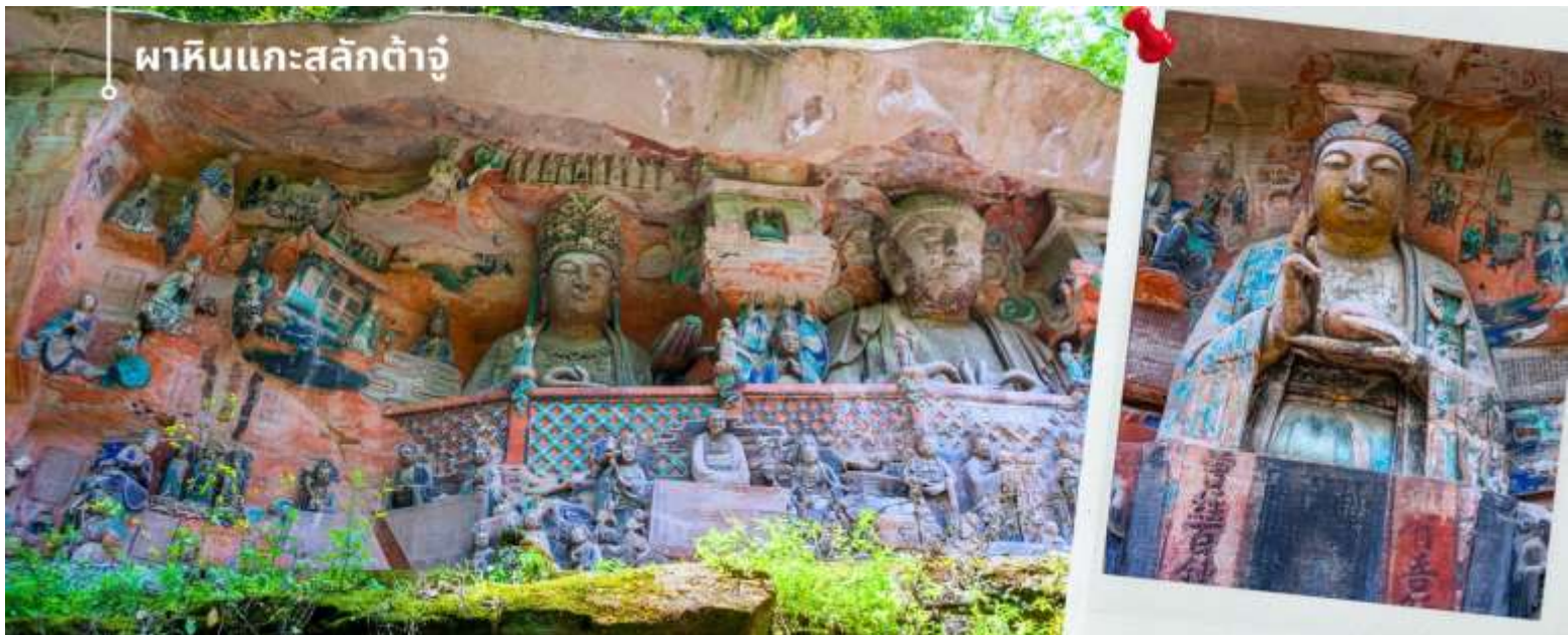
พาคินแกะสลักตัวจู้

นำท่านเดินทางสู่ วัดหลัวฮั่น (Luohan Temple) วัดสำนักงานใหญ่พุทธสมาคมแห่งนครฉงชิ่ง เป็นวัดเก่าแก่ที่สุดในฉงชิ่ง (Chongqing) ซึ่งสร้างขึ้นเมื่อ 1,000 ปีก่อน มีประวัติความเป็นมายาวนานเป็นจุดหมายทางศาสนาและเป็นศูนย์กลางของชาวพุทธในภูมิภาคการท่องเที่ยวที่สำคัญของภูมิภาค และเป็นแหล่งเรียนรู้ที่สำคัญของศิลปวัฒนธรรมจีน วัดนี้ประดิษฐานพระอรหันต์ถึง 500 องค์ แต่ละองค์มีลักษณะ ท่าทาง และสีหน้าแตกต่างกัน มีสถาปัตยกรรมแบบจีนโบราณที่สวยงามและละเอียดอ่อน พระอรหันต์ 500 องค์ แกะสลักด้วยหินและไม้ สะท้อนถึงความเชื่อในพุทธศาสนาและมีมือศิลปะจีน