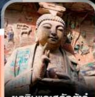
พาคินแกะสลักตัดजू