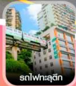
รถไฟพระสุตัก

✈️ คอนเฟิร์มออกเดินทาง ทุกพีเรียด 2 ท่านขึ้นไป