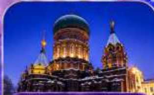
ST. SOPHIA CATHEDRAL โบสถ์เซนต์โซเฟีย (ด้านนอก)