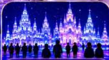
HARBIN ICE & SNOW WORLD เทศกาลน้ำแข็งระดับโลก