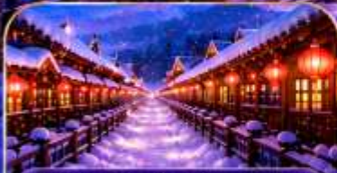
XUEXIANG SNOW VILLAGE หมู่บ้านหิมะสุดโรแมนติก