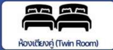
ห้องเตียงคู่ (Twin Room)