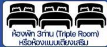
ห้องพัก 3 ท่าน (Triple Room) หรือห้องแบบเตียงเสริม

กรณีพัก 3 ท่านถ้าวันที่เข้าพักโรงแรม ไม่มีห้อง TRP (3 ท่าน) อาจจำเป็นต้องแยกพัก 2 ห้อง (มีค่าใช้จ่ายพักเดี่ยวเพิ่ม) กรณีห้อง TWIN BED (เตียงเดี่ยว 2 เตียง) ซึ่งโรงแรมไม่มีหรือเต็ม ทางบริษัทขอปรับเป็นห้อง DOUBLE BED แทนโดยมีต้องแจ้งให้ทราบล่วงหน้า หรือหากต้องการห้องพักแบบ DOUBLE BED ( 1 เตียงใหญ่) ซึ่งโรงแรมไม่มีหรือเต็ม ทางบริษัทขอปรับเป็นห้อง TWIN BED แทนโดยมีต้องแจ้งให้ทราบล่วงหน้ากรณีห้องพักในเมืองที่ระบุไว้ในโปรแกรมมีเทศกาลวันหยุดยาว มีงานประชุมหรืองานแฟร์ต่างๆ บริษัทขอจัดที่พักในเมืองใกล้เคียงแทน