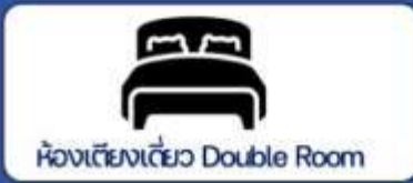
ห้องเตียงเดี่ยว Double Room