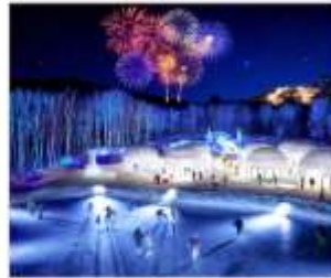
หมู่บ้านน้ำแข็งโทมามู