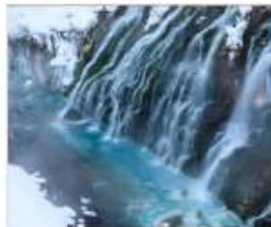
น้ำตกชิราอิเกะ