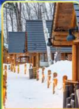
นิงเกิ้ลทอเรส