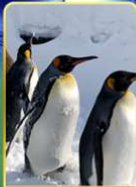
พาร์คนกเพนกวิน