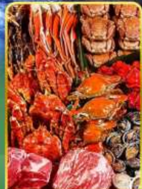
บิจ่างพรีเมียมมันตะ

🔥 ออนเซ็น 2 คั้น 🧳 มน.กระเป๋า 1 ใบ 23 กก 🌞 7Days 5Night