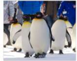
ชมพาเหรดแพนกวิน