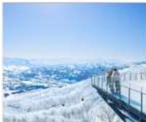
ชมวิวFOREST OF TREE