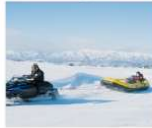
กิจกรรมบีโบนอร์แอนด์