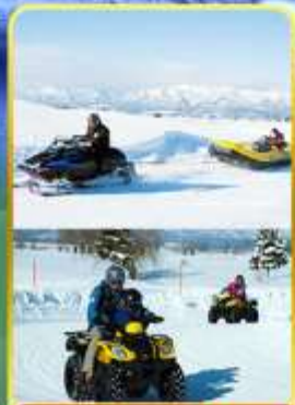
BIBAI SNOW LAND