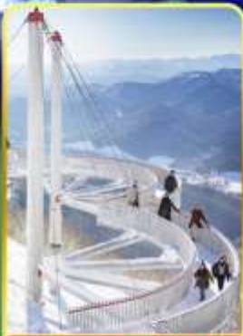
ระเบียงหมอกน้ำแข็ง