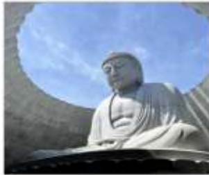
HILL OF BUDDHA