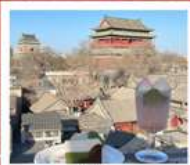
คาเฟ่ น้ำตาล