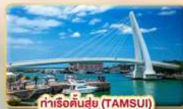
ท่าเรือคันทันซุย (TAMSUI)