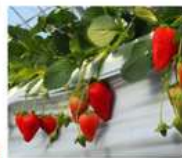
สวนสตรอว์เบอร์รี่