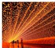
นานานะ โนะ ซาโตะ