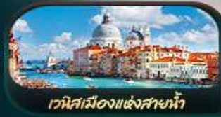
เวนิสเมืองแห่งสายน้ำ