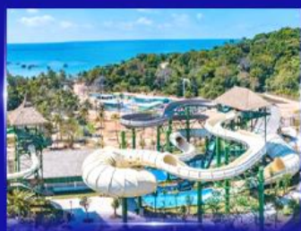
สวนสนุก Sun world Hon thom