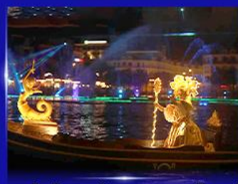
ชมโชว์เวนิสจำลอง แกรนด์วิลด์