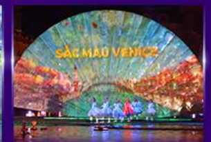
Sac Mau Venice Show