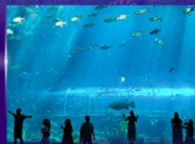
อควาเรียมยักษ์รูปเต่า