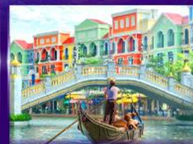
เวนิสจำลอง แกรนด์ เวิลด์