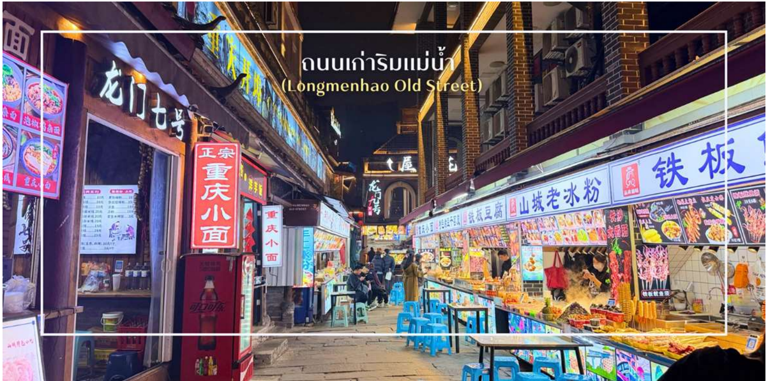
ถนนเก่าริมแม่น้ำ (Longmenhao Old Street)

จากนั้นนำท่านสู่ ถนนเก่าริมแม่น้ำ Longmenhao Old Street อีกหนึ่งแลนด์มาร์กสำคัญของเมืองฉงชิ่ง ตั้งอยู่ในเขตหนานอัน ริมฝั่งแม่น้ำแยงซี โดยถนนสายนี้เคยเป็นย่านการค้าและศูนย์กลางเศรษฐกิจที่รุ่งเรืองในยุคราชวงศ์หมิงและชิง ปัจจุบันได้รับการอนุรักษ์ไว้อย่างดี เพื่อเป็นแหล่งเรียนรู้ทางประวัติศาสตร์ และแหล่งท่องเที่ยวเชิงวัฒนธรรมที่เต็มไปด้วยเสน่ห์ บรรยากาศของถนนยังคงอบอวลไปด้วยกลิ่นอายวันวาน อาคารบ้านเรือนแบบโบราณ