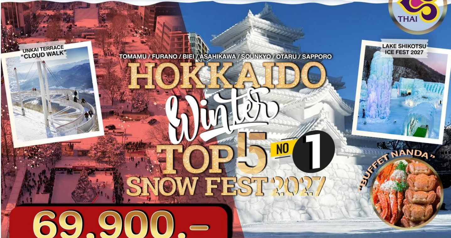
UNKAI TERRACE "CLOUD WALK"

TOMAMU / FURANO / BIEI / ASAHIKAWA / SOUNKYO / OTARU / SAPPORO