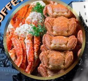
SAPPORO SNOW FESTIVAL 2027