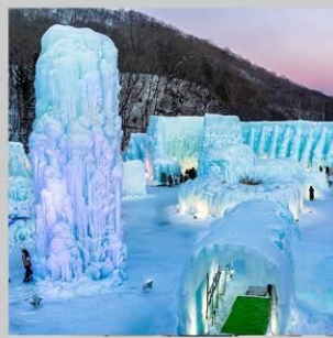
"LAKE SHIKOTSU FEST"