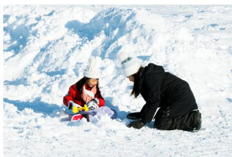
Playing in the snow