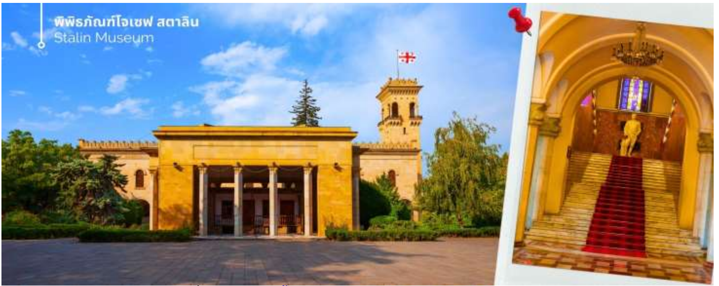
พิพิธภัณฑ์โจเซฟ สตาลิน Stalin Museum

นำท่านเดินทางชมถ้ำโบราณ เมืองถ้ำโบราณอูปลิสต์ซิกเค ได้รับการระบุโดยนักโบราณคดีว่าเป็นหนึ่งในแหล่งที่อยู่อาศัยในเมืองที่เก่าแก่ที่สุดในจอร์เจีย ถ้ำส่วนใหญ่ไม่มีการตกแต่งใดๆ แม้ว่าโครงสร้างขนาดใหญ่บางแห่งจะมีเพดานโค้งแบบอูมิงค์ที่แกะสลักหินเลียนแบบท่อนซุง โครงสร้างขนาดใหญ่บางแห่งยังมีช่องเล็กๆ อยู่ด้านหลังหรือด้านข้าง ซึ่งอาจใช้สำหรับพิธีกรรม ด้านหน้าของห้องโถงพิธีกรรมขนาดใหญ่ทางตอนใต้ตกแต่งด้วยซุ้มโค้งแบบโรมันที่มีหน้าจั่ว มหาวิหารในศตวรรษที่ 6 ส่วนใหญ่แกะสลักเข้าไปในหิน ยกเว้นกำแพงด้านใต้ที่สร้างจากหิน ที่จุดสูงสุดของบริเวณนั้นมีมหาวิหาร คริสเตียน ที่สร้างด้วยหินและอิฐในศตวรรษที่ 9-10 การขุดค้นทางโบราณคดีได้ค้นพบสิ่งประดิษฐ์มากมายจากยุคต่างๆ รวมถึงเครื่องประดับทองคำ เงิน และทองสัมฤทธิ์ ตลอดจนตัวอย่างเครื่องปั้นดินเผาและประติมากรรม สิ่งประดิษฐ์เหล่านี้จำนวนมากได้รับการเก็บรักษาไว้ในพิพิธภัณฑ์แห่งชาติในกรุงทбилиซี