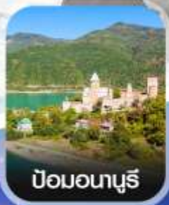
ป้อมอนาบูรี