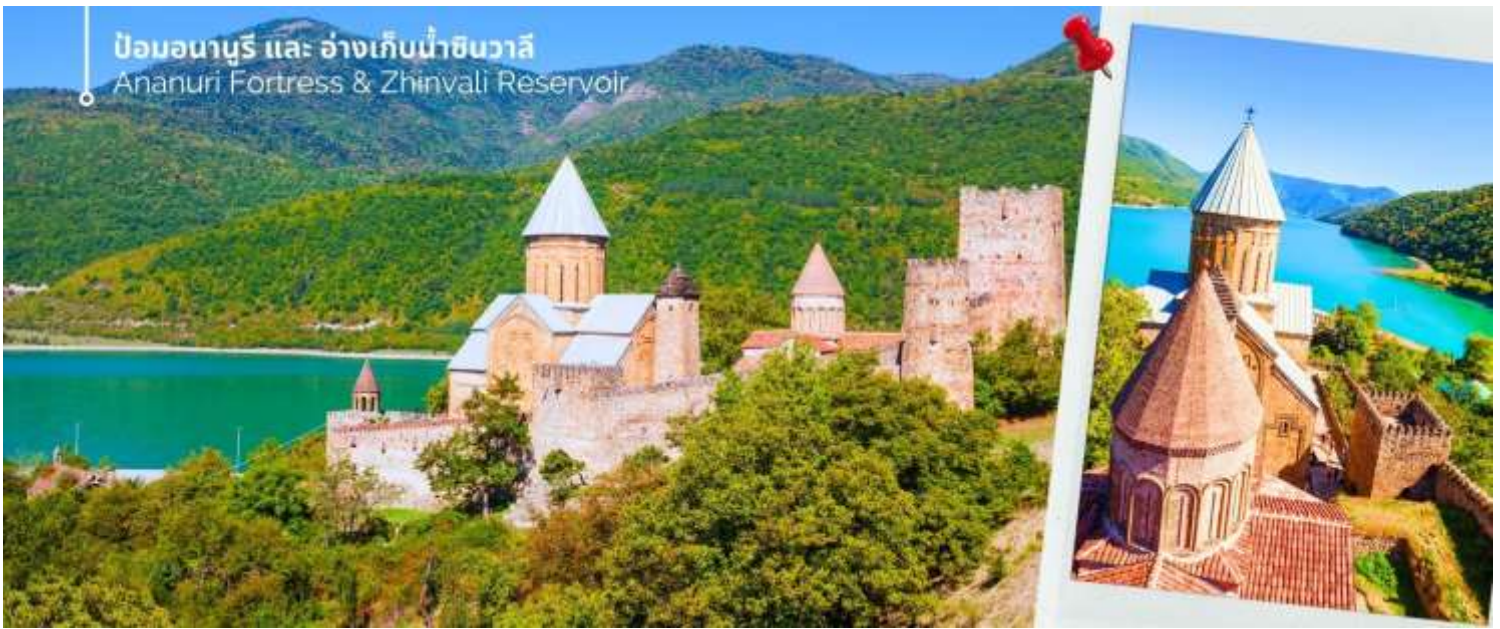
ป้อมอนาบุรี และ อ่างเก็บน้ำชินวาลี Ananuri Fortress & Zhinvali Reservoir

จากนั้นนำท่านถ่ายภาพความงามของ อ่างเก็บน้ำชินวาลี (Zhinvali Reservoir) เป็นอ่างเก็บน้ำที่สวยงามและมีชื่อเสียง สร้างขึ้นในปี 1986 ด้วยวัตถุประสงค์หลักเพื่อผลิตไฟฟ้าพลังน้ำและจัดสรรน้ำสำหรับการอุปโภคบริโภค โอบล้อมด้วยทิวทัศน์อันตระการตา ด้วยภูเขาและป่าไม้อันเขียวขจี และความหลากหลายทางธรรมชาติ