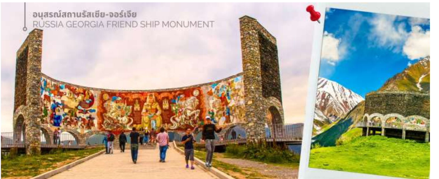
อนุสรณ์สถานรัสเซีย-จอร์เจีย RUSSIA GEORGIA FRIENDSHIP MONUMENT

จากนั้นนำท่านแวะถ่ายภาพและชมความงามของ อนุสรณ์สถานรัสเซีย-จอร์เจีย (RUSSIA GEORGIA FRIENDSHIP MONUMENT) เป็นอนุสรณ์หินคอนกรีตทรงกลมขนาดใหญ่ สร้างขึ้นในปี ค.ศ. 1983 เพื่อเฉลิมฉลองครบรอบ 200 ปีของสนธิสัญญาจอร์จียสกี (Treaty of Georgie ski) ซึ่งเป็นการแสดงถึงความสัมพันธ์อันดีระหว่างรัสเซียและจอร์เจียในช่วงเวลานั้น อนุสรณ์สถานนี้มี ความสูงประมาณ 20 เมตร และถูกออกแบบในสไตล์สถาปัตยกรรมโซเวียต ตัวอาคารมีรูปทรงกลมขนาดใหญ่ ภายในตกแต่งด้วยกระเบื้องโมเสกสีสันสดใส ซึ่งบอกเล่าเรื่องราวประวัติศาสตร์และวัฒนธรรมของทั้งสองชาติ ตั้งอยู่บนเส้นทางระหว่างเมืองกูตาอูรีและคาซเบกิ และทำเลบนยอดเขาสูง ทำให้เป็นจุดชมวิวที่สามารถมองเห็นทิวทัศน์อันงดงามของเทือกเขาคอเคซัสได้ ปัจจุบัน อนุสรณ์สถานแห่งนี้ยังคงตั้งอยู่ แต่ความหมายของมันได้เปลี่ยนแปลงไปอย่างสิ้นเชิง หลังจากการล่มสลายของสหภาพโซเวียต โดยเฉพาะอย่างยิ่งสงครามรัสเซีย-จอร์เจียในปี ค.ศ.2008 ทำให้ความสัมพันธ์ระหว่างสองประเทศตึงเครียดขึ้นอย่างมาก และส่งผลกระทบต่อความหมายของอนุสรณ์สถานแห่งนี้