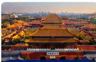
พระราชวังต้องห้ามกุ๊กกง