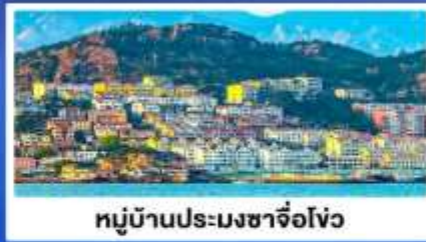
หมู่บ้านประมงซาจื่อโจว