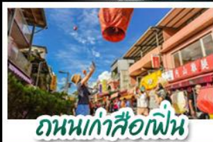
ถนนเก่าซือเฟิ่น