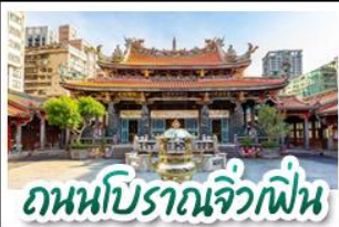
ถนนโบราณจิวเฟิ่น

ทะเลสาบสุริยันจันทรา - ล่องเรือชมวิว - จิวเฟิ่น ซือเฟิ่น - TAIPEI 101 - ชิเหมินตง หนานโตว 1 คืน ไทเป 2 คืน