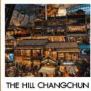
THE HILL CHANGCHUN