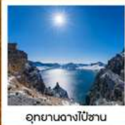
อุทยานดางไป่ซาน