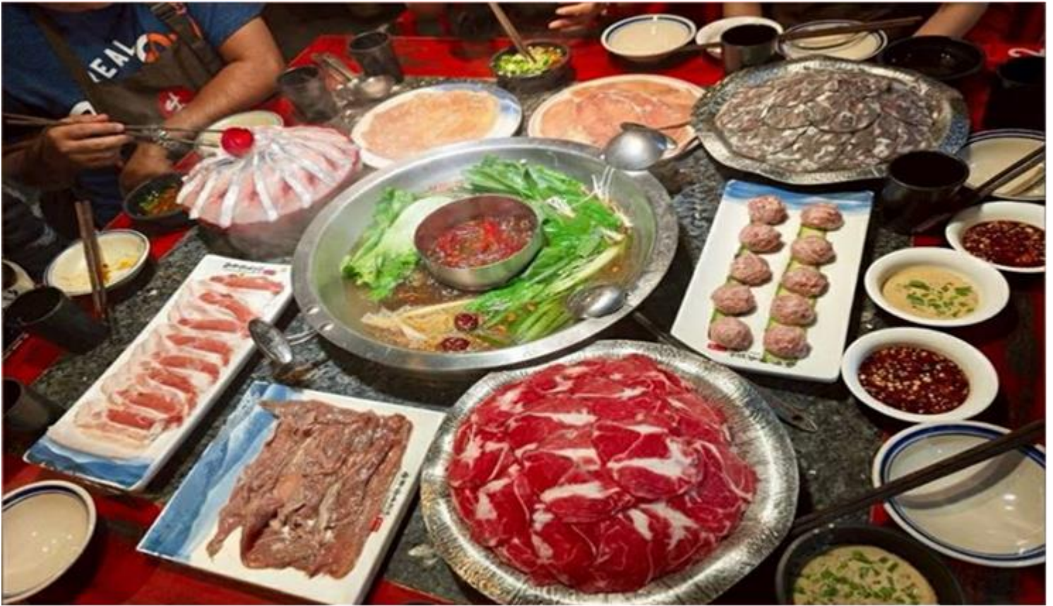
คำ รับประทานอาหารคำ ณ ภัตตาคาร (เมื่อที่ 12) *เมนูพิเศษสุกี้หม่าล่าเสฉวน

ดั้งเดิม มีทั้งแบรนด์แฟชั่นระดับโลกอย่าง Gucci, Chanel, Balenciaga รวมถึงร้านค้าไลฟ์สไตล์และแฟชั่นท้องถิ่น อาหารท้องถิ่นและคาเฟ่นานาชาติสวยๆ ที่เหมาะสำหรับการนั่งพักผ่อน