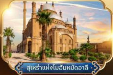
สุเหร่าแห่งโมฮัมหมัดอวาลี