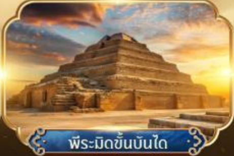
พีระมิดขั้นบันได

เริ่มต้น 48,800 ★ ตั๋วเครื่องบินมหาสฟิงซ์และ พีระมิดแห่งกิซ่า ★ ชมพิพิธภัณฑ์แกรนด์อียิปต์ GEM