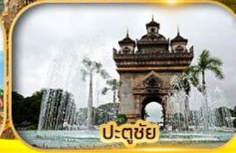
ประตูลอย