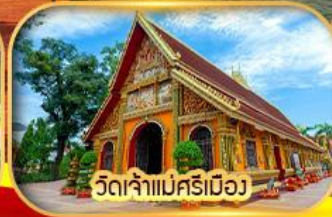
วัดจำแม่ศรีเมือง