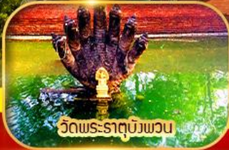
วัดพระธาตุบึงพวน