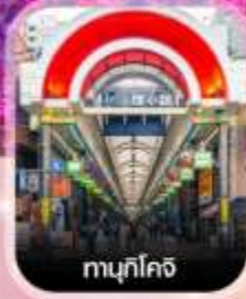
ทามุกิโคจิ