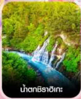
น้ำตกชิราอิเกะ