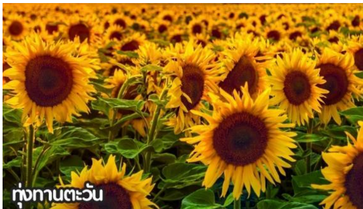
ทุ่งทานตะวัน