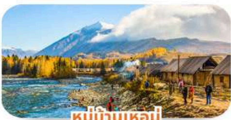
หมู่บ้านเหม่จู