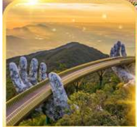
สะพานมือยักษ์