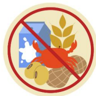
● แพ้อาหาร / อื่นๆโปรดระบุ