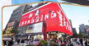
ถนนคนเดินถวณอันเฉียว