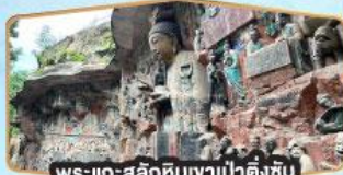
พระแกะสลักหินเขาป่าตึงซัน