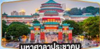
มหาศาลาประชาชน