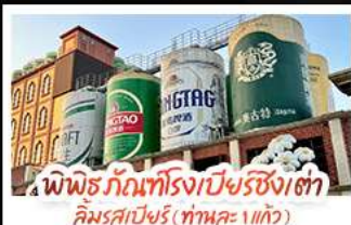
พิพิธภัณฑ์โรงเบียร์ชิงเต่า คิมรสเบียร์ (ทานคะ 1 แก้ว)