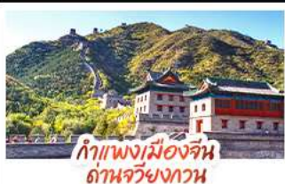
กำแพงเมืองจีน ด่านจวิ้นกวน

ล่องเรือสุดโรแมนติกแม่น้ำหวงผู้ ปักกิ่ง..เปิดประตูสู่แดนมังกร ด้วยความอลังการระดับจักรพรรดิ ชิงเต่า..เมืองชายทะเลสไตล์ยุโรป หอระฆังแบบพอนทอเรียล เซี่ยงไฮ้..มหานครแห่งเอเชีย เมืองที่ไม่เคยหลับใหล