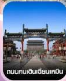
ถนนคนเดินเฉียนเหมิน

✈️ คอนเฟิร์มออกเดินทาง ทุกพีเรียด 2 ท่านขึ้นไป