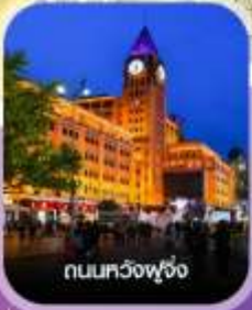
ถนนหวงฟู่จิ้ง