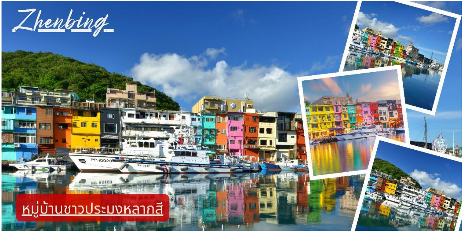
หมู่บ้านชาวประมงหลากสี

เยี่ยมชม หมู่บ้านชาวประมงหลากสี Zhenbing ซึ่งสะท้อนถึงการพัฒนาชุมชนริมทะเลแบบยั่งยืน บ้านเรือนสีสันสดใสและบรรยากาศริมทะเลช่วยให้ผู้มาเยือนได้เรียนรู้เรื่อง วัฒนธรรมชุมชนประมงและภูมิสถาปัตยกรรมท้องถิ่น