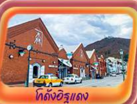
ท่องเที่ยวโอตารุ

✈️ สายการบิน Thai Airways (TG) น้ำหนักกระเป๋า 23 KG