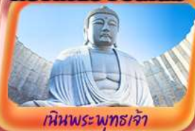
เดินชมพระพุทธรูป