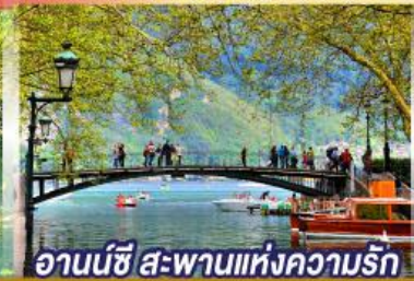
อานันชี สะพานแห่งความรัก