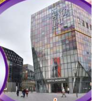
ชานหลู่กุน