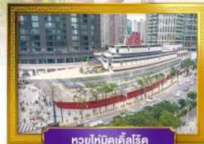
ทวยไห่บิคเคิลโรด