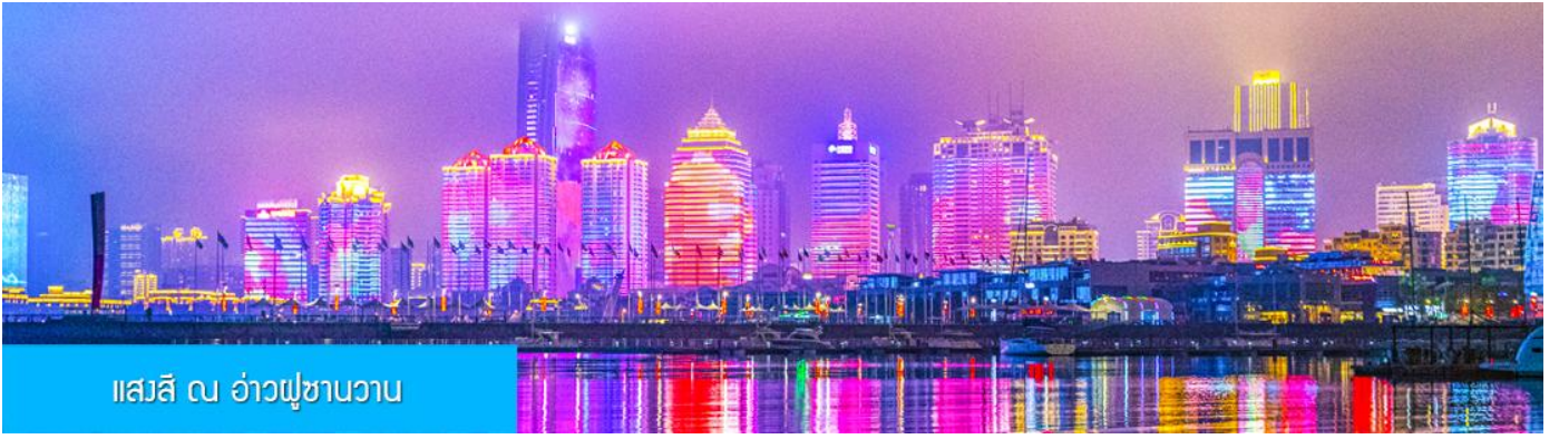
แสงสี ณ อ่าวฟูซานวาน