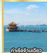
กำแพงเจ้านเฉียว