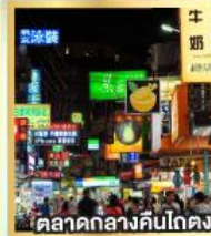
ตลาดกลางคืนโกตง