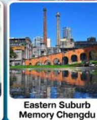
Eastern Suburb Memory Chengdu