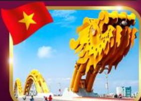
แลนด์มาร์กสะพานมังกร ดานัง