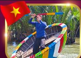
ล่องเรือกระด้ง หมู่บ้านทับทิม