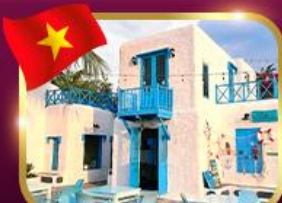
คาเฟ่สไตล์ซานโตรินี่ ซันทรา มาริน่า