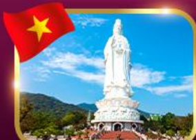
ชมพระองค์กวนอิม วัดหลินอึ้ง