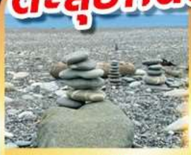
หาดซีซิง

เดินชมวิวเกาะเหอผิง ตะลุยกินตลาดมึชลินเหลาเหอ