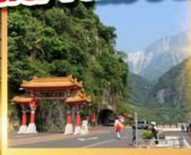
อุทยานทงโรโกะ