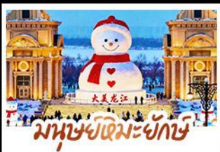
มาฆะขิมะยักษ์