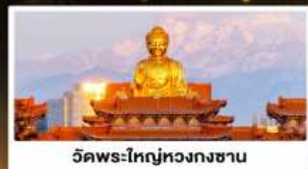
วัดพระใหญ่หวงกงซาน