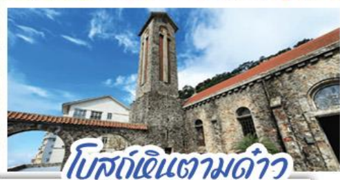
โบสถ์หินตามด้าว