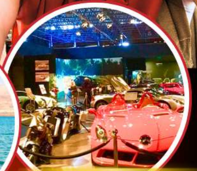
Royal Automobile Museum