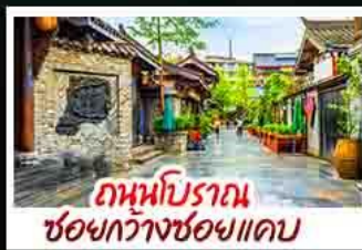
ถานนิบราณ เซอชวงกวางชอยแคบ