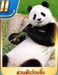
สวนสัตว์จงชิ่ง