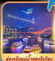
ส่องเรือแม่น้ำแยงซีเกียง