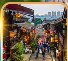
หมู่บ้านโบราณฉือชิว