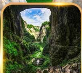
อุทยานหลุมฟ้า 3 สะพานสวรรค์