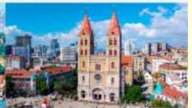
โบสถ์คริสต์เซนต์ไมเคิล

*ทางบริษัทฯ ขอสงวนสิทธิ์ในการสลับโปรแกรมทัวร์ตามความเหมาะสมขึ้นอยู่กับสถานการณ์หน้างาน โดยคำนึงถึงผลประโยชน์ของลูกค้าเป็นสำคัญ