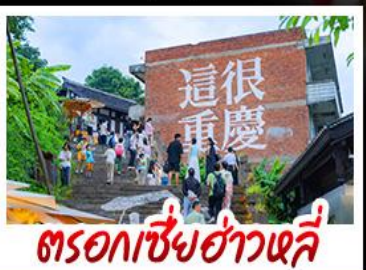
ตรอกเซี่ยฮ่าวหลี่