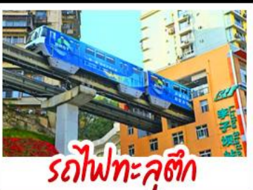
รถไฟทะลุติ๊ก