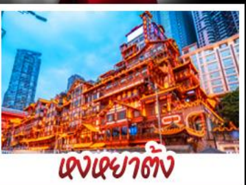
ตงเต๋ยาตัง