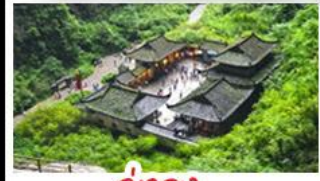
อุบลราชธานี

สวนม่านฮวา - สี่ดรุณี - อุทยานนางฟ้า อุทยานหลุมบ่อฟ้าสะพานสวรรค์ - อุโมง รถไฟฟ้าทะเลสาบ - สะพานหนานเฉียว