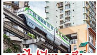
รถไฟฟ้าทะเลสาบ